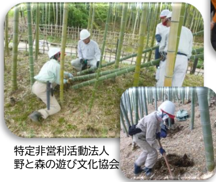
特定非営利活動法人 野と森の遊び文化協会