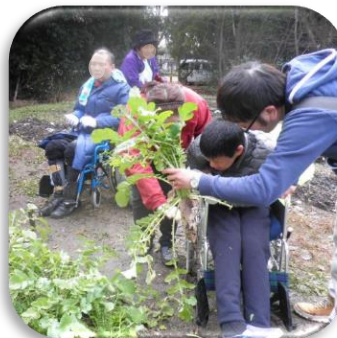
万博 NPO センター全体としての取組