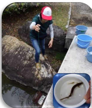
特定非営利活動法人 インクルージョンプログラム ラボラトリ