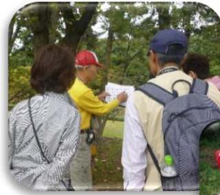
特定非営利活動法人 大阪府民循環型社会推進機構