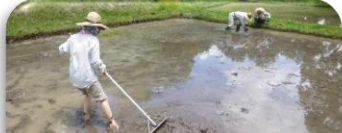
特定非営利活動法人野と森の遊び文化協会